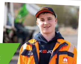
TIEFBAUFACHARBEITER, STRASSEN- & KANALBAUER

Die Ausbildung dauert 2 oder 3 Jahre und findet im Betrieb, in der Berufsschule und in der überbetrieblichen Ausbildung statt.