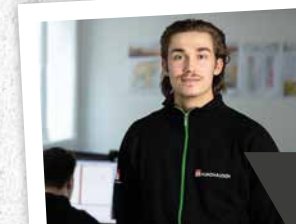
WERKSTUDENT & STUDENTISCHE HILFSKRAFT

Du absolvierst ein Bauingenieur-Studium mit gleichzeitiger Berufspraxis. Entweder durch eine handwerkliche Ausbildung oder ingenieurmäßige Praxisphasen. Wir bieten dir Studiengänge an der Technischen Hochschule Mittelhessen, der Universität Siegen oder an der Berufsakademie in Glauchau an.