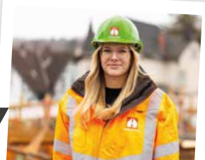
DUALES STUDIUM BAUINGENIEURWESEN

Du absolvierst ein Bauingenieur-Studium mit gleichzeitiger Berufspraxis. Entweder durch eine handwerkliche Ausbildung oder ingenieurmäßige Praxisphasen. Wir bieten dir Studiengänge an der Technischen Hochschule Mittelhessen, der Universität Siegen oder an der Berufsakademie in Glauchau an.